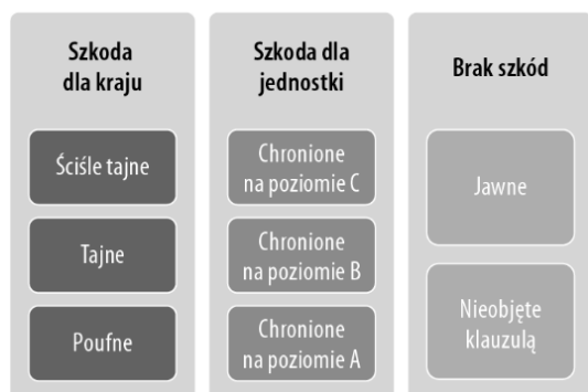
Rysunek 2.2. Klasyfikacja informacji stosowana przez Boba w pracy

Bob zawsze klasyfikuje (decyduje o klauzuli tajności) i oznacza zbierane przez siebie informacje, dzięki czemu każdy członek zespołu wie, jak się z nimi właściwie obchodzić. Gdyby były nieoznaczone, ktoś mógłby popełnić błąd i niechcący ujawnić lub zostawić bez ochrony bardzo wartościowe i (lub) wrażliwe informacje. Wiele systemów baz danych (m.in. Microsoft SQL Server) pozwala dodawać do pól danych lub tabel poziom klasyfikacji. Jeśli baza danych nie zapewnia natywnie