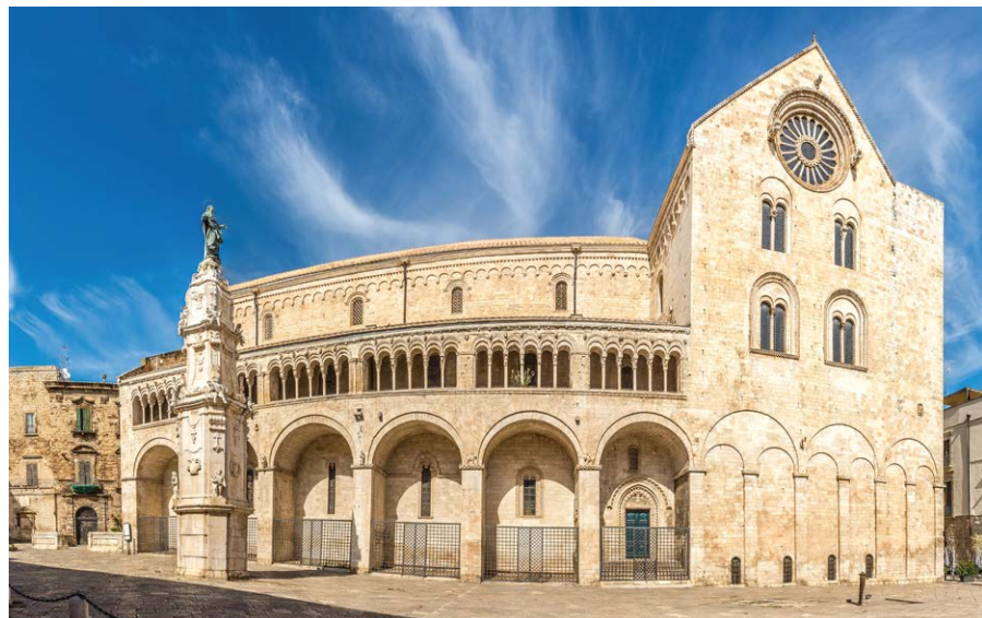
▲ Katedra Wniebowzięcia NMP

Jeśli tuż za kościołem Czyścowskim skręcimy w prawo w Corte Vescovado i przejdziemy przez bramę znajdującą się na końcu tego zaułka, dotrzemy na szeroki dziedziniec otoczony z trzech stron przez