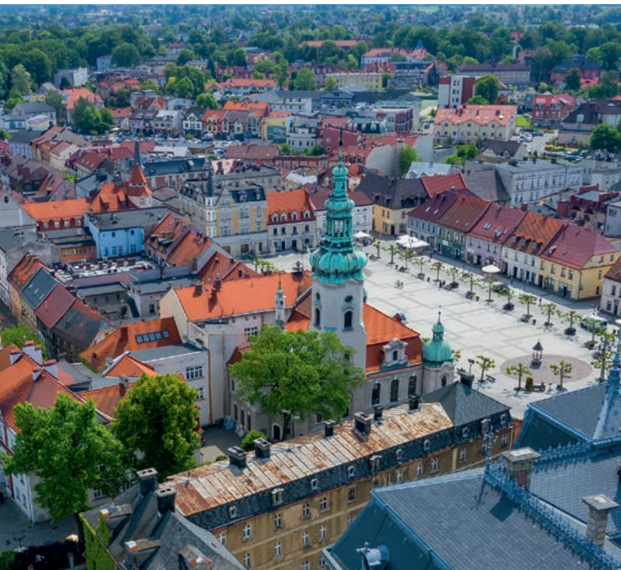
▲ Pszczyńska starówka

XVIII-wiecznych kamienic, zdobionych często godłami cechowymi.