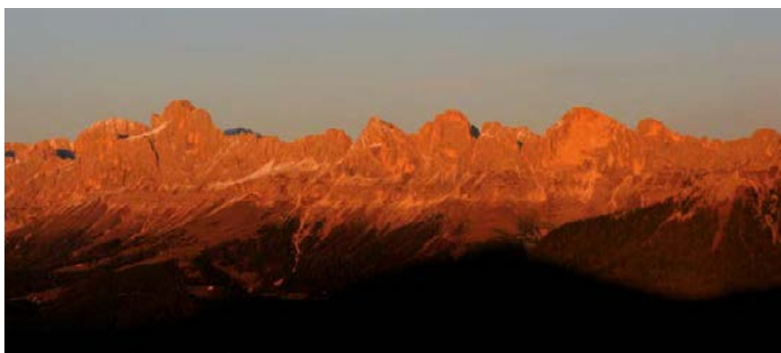
♣ ZJAWISKO „ENROSADIRA” W MASYWIE CATINACCIO, OBSERWOWANE Z PRZEŁĘCZY PASSO DI OCLINI.