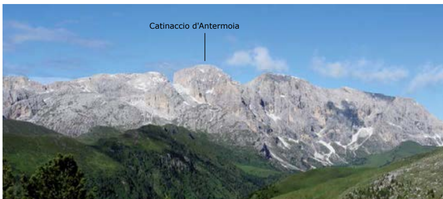
♣ MASYW CATINACCIO.