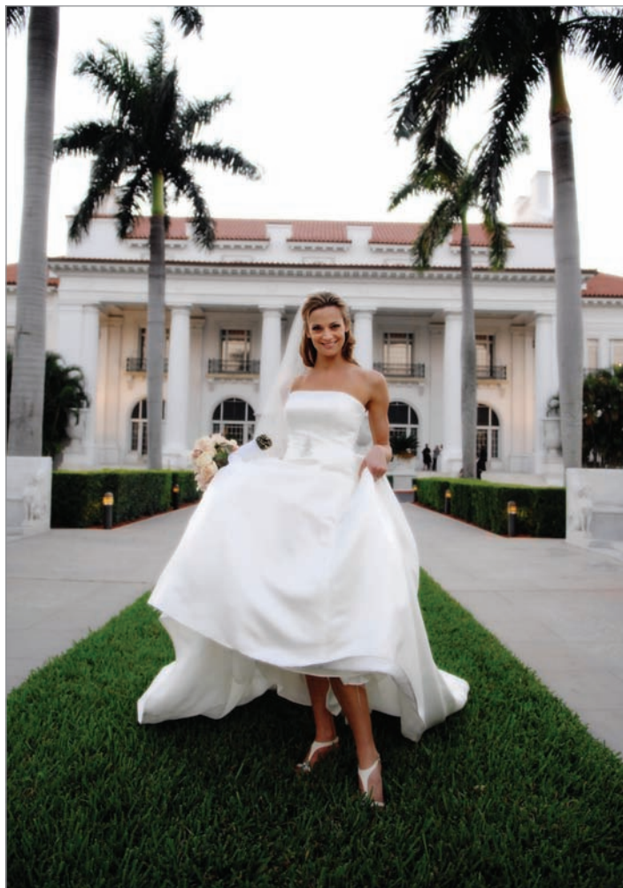
459 (PONIŻEJ).