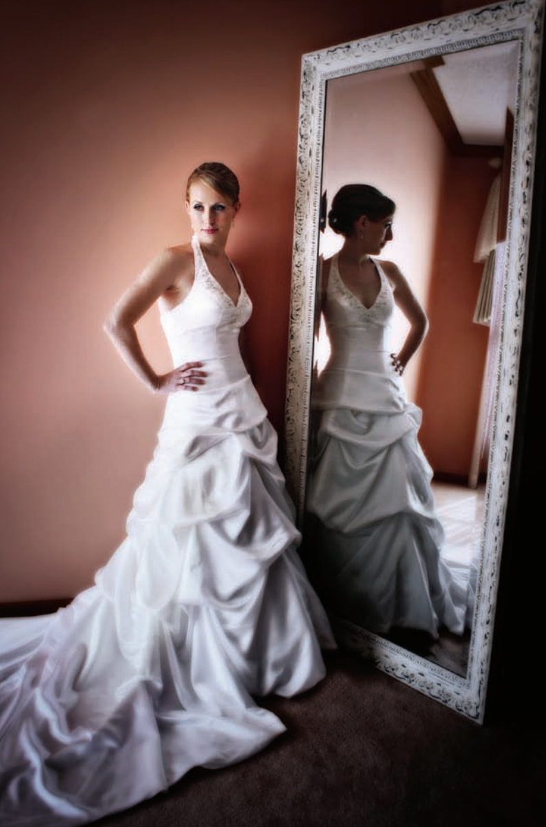
446 (PO LEWEJ).