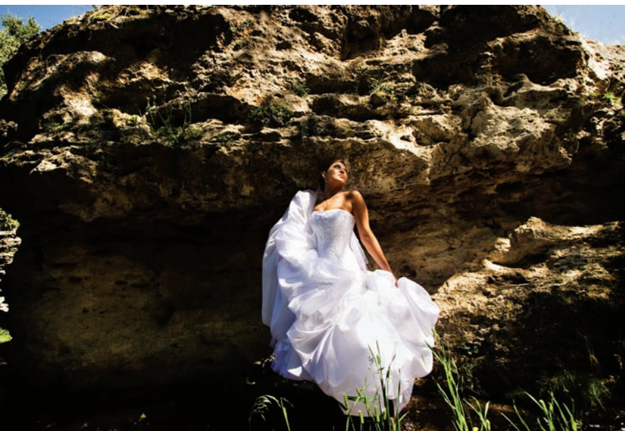
432 (POWYŻEJ).