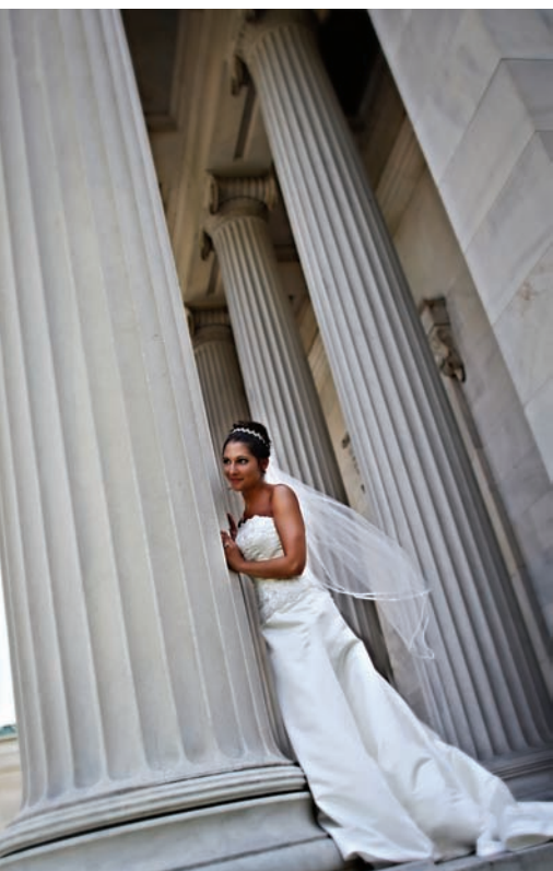
448. AUTORKĄ ZDJĘCIA JEST TRACY DORR