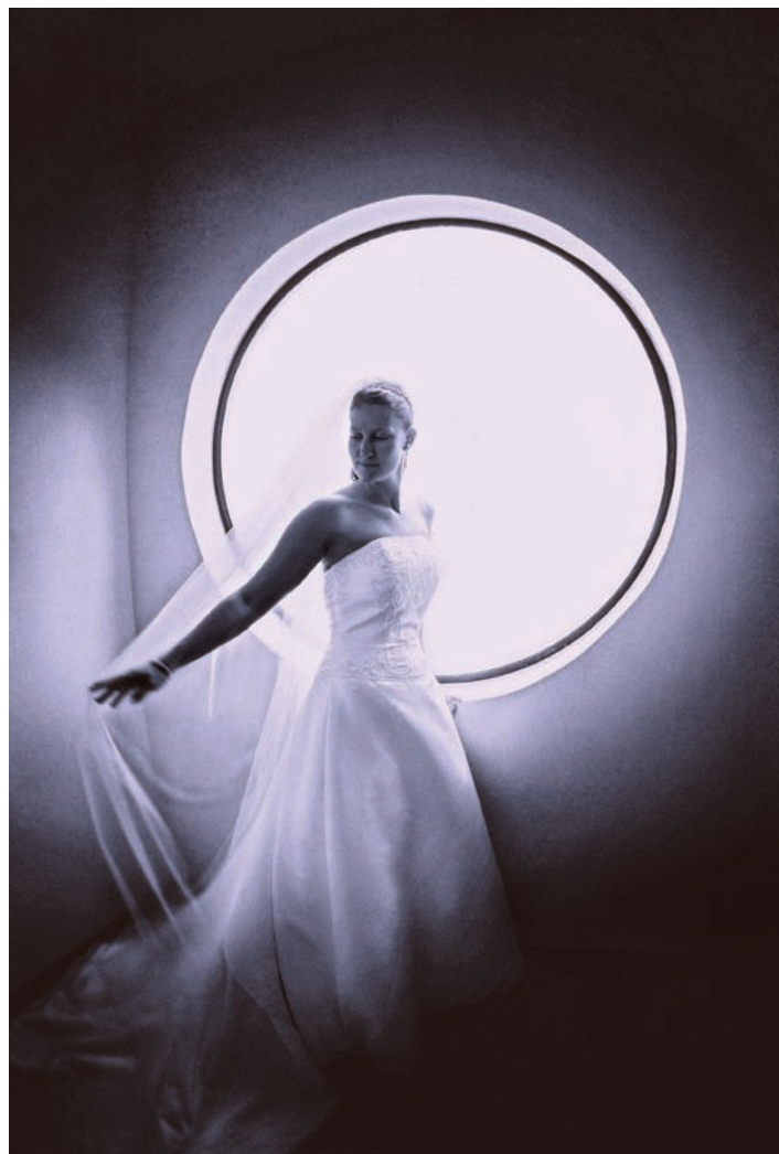
447 (PONIŻEJ).