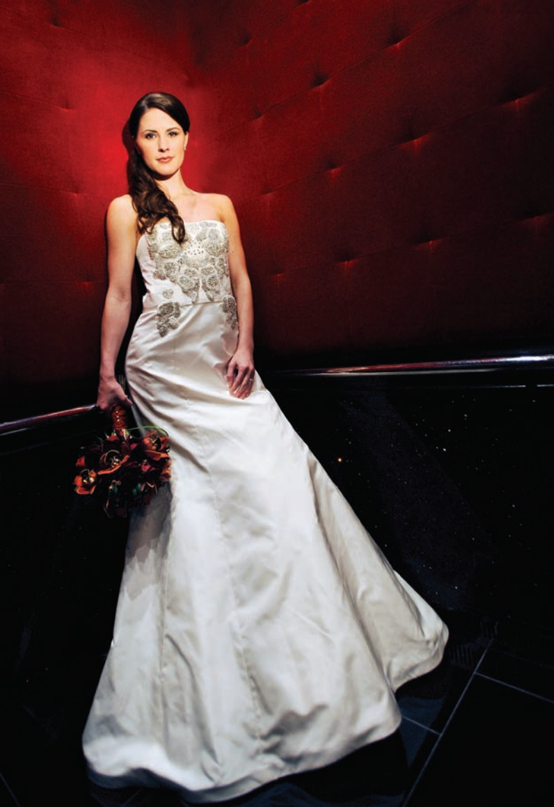
458 (PO LEWEJ).