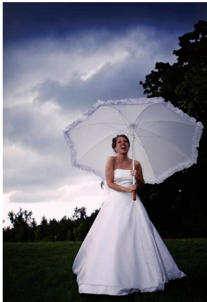
433 (PO PRAWIEJ).