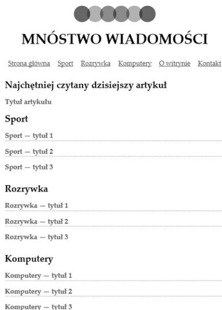
Rysunek 4.3. Witryna z wiadomościami na smartfonie

Korzystanie z zapytań o media oznacza na ogół pokazywanie lub ukrywanie treści w zależności od rozmiaru ekranu. Wiele witryn, takich jak http://youtube.com/ , http://facebook.com/ , http://cnn.com/ oraz http://nfl.com/ , wykrywa, czy użytkownik używa urządzenia przenośnego, i przekierowuje go na wersje przeznaczone dla takich urządzeń. Witryny te zawierają dużo treści z mnóstwem danych, zdjęć, filmów wideo, reklam, Flasha i innych rzeczy — gdyby korzystać tylko z zapytań o media, smartfon nadal musiałby pobierać wszystkie te dane, mimo że użytkownik nie mógłby ich zobaczyć. A zatem to, czy potrzebujesz jedynie nowych stylów, czy zupełnie oddzielnej witryny dla urządzeń przenośnych, zależy od treści witryny, ale jeśli masz zmienić jedynie układ i dodać kilka szczegółów, wtedy powinieneś prawdopodobnie użyć zapytań o media. Kilka znakomych sposobów ich użycia znajdziesz na http://mediaqueri.es/ .