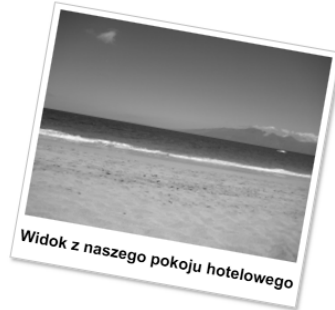
Rysunek 4.8. Obrazek i tekst obrócone za pomocą CSS-a

Pellentesque habitant morbi tristique senectus et netus et malesuada fames ac turpis egestas. Vestibulum tortor quam, feugiat vitae, ultricies eget, tempor sit amet, ante. Donec eu libero sit amet quam egestas semper. Aenean ultricies mi vitae est. Mauris placerat eleifend leo. Quisque sit amet est et sapien ullamcorper pharetra. Vestibulum erat wisi, condimentum sed, commodo vitae, ornare sit amet, wisi. Aenean fermentum, elit eget tincidunt condimentum, eros ipsum rutrum orci, sagittis tempus lacus enim ac dui. Donec non enim in turpis pulvinar facilisis. Ut felis.