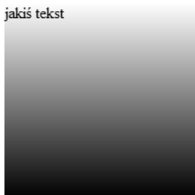
Rysunek 4.5. Prosty liniowy gradient CSS

Najpierw zostaje określony rodzaj gradientu (liniowy lub radialny), po czym następują nawiasy, w których zapisany jest początkowy i końcowy kolor gradientu. Zauważ, że kod ma cztery różne deklaracje. Pierwsza zawiera gradient w postaci pliku graficznego, na wypadek gdyby przeglądarka nie obsługiwała gradientów CSS3; -moz-linear-gradient jest przeznaczona dla przeglądarek Mozilla (Firefox); -webkit-linear-gradient dla przeglądarek opartych na WebKit (Safari i Chrome); ostatnia deklaracja linear-gradient jest oficjalną składnią gradientu CSS3, ale obecnie żadna przeglądarka jej nie obsługuje.