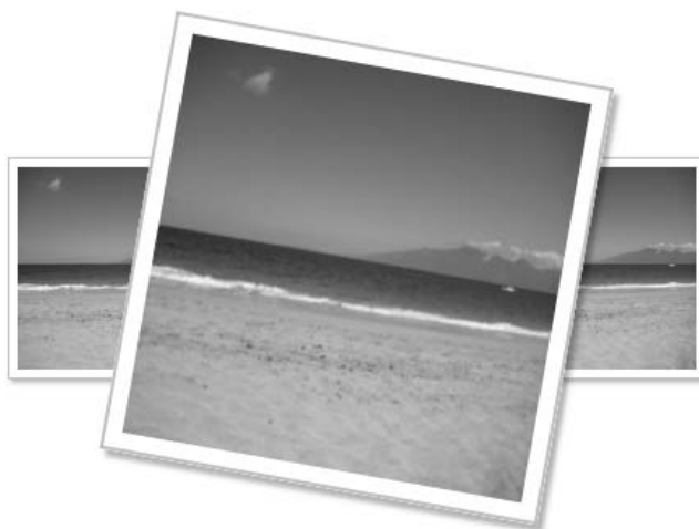
Rysunek 4.12. Obrazek z galerii zdjęć po najechaniu na niego kursorem