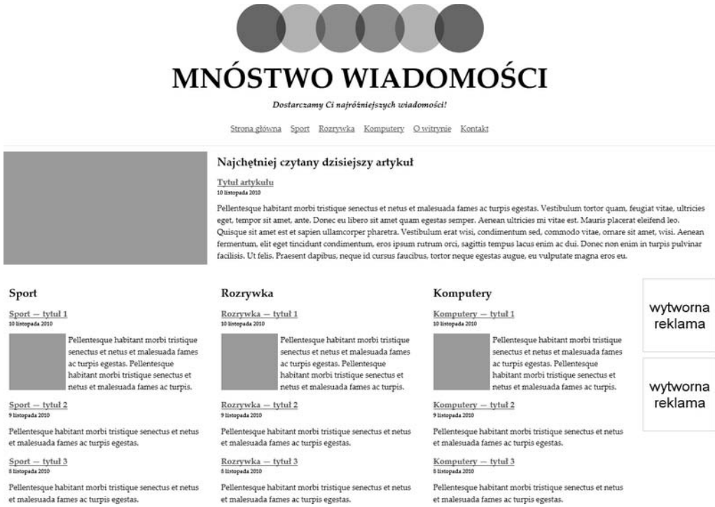
Rysunek 4.1. Witryna z wiadomościami z domyślnym CSS-em

Rysunek 4.2 pokazuje układ na mniejszym ekranie z wykorzystaniem zapytań o media z listingu 4.5.