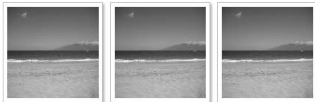
Rysunek 4.11. Galeria zdjęć przed przejściami

float: left; height: 125px; margin: 0 10px 0 0; padding: 5px; width: 125px; -webkit-box-shadow: 2px 2px 4px rgba(0,0, 0, 0.3); -moz-box-shadow: 2px 2px 4px rgba(0,0, 0, 0.3); box-shadow: 2px 2px 4px rgba(0,0, 0, 0.3); -webkit-transition: all 1s ease-in-out; -moz-transition: all 1s ease-in-out; -o-transition: all 1s ease-in-out; } img:hover { -webkit-transform: rotate(10deg) scale(2); -moz-transform: rotate(10deg) scale(2); -o-transform: rotate(10deg) scale(2); -ms-transform: rotate(10deg) scale(2); transform: rotate(10deg) scale(2); }