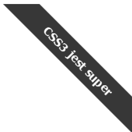
Rysunek 4.13. Animowany kolor tła

} } keyframes glow { 0% { background: #F00; } 25% { background: #06C; } 50% { background: #000; } 75% { background: #06C; } 100% { background: #F00; } }