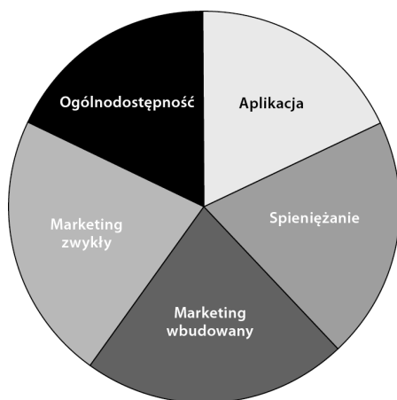
Rysunek 6.2. Ciastko sukcesu aplikacji

Pięć kluczowych aspektów to: aplikacja , ogólnodostępność , spieniężanie , marketing wbudowany , marketing zwykły . Na rysunku 6.2 przedstawiam ciastko sukcesu aplikacji .