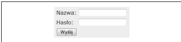
Rysunek 7.1. Strona facetów JSF wyświetlona w oknie przeglądarki internetowej

Powyższy kod wyświetla tabelę złożoną z dwóch wierszy i trzech kolumn (patrz rysunek 7.1).