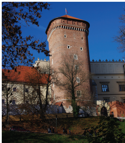
▲ Baszta Senatorska

Omijając wzniesiony przez władze austriackie potężny gmach, obecnie mieszczący centrum wystawowo-konferencyjne, dostrzeżemy trzecią z zachowanych w całości baszt obronnych Wawelu. Jest