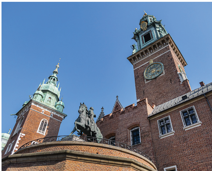
▲ Wieża Zygmuntońska