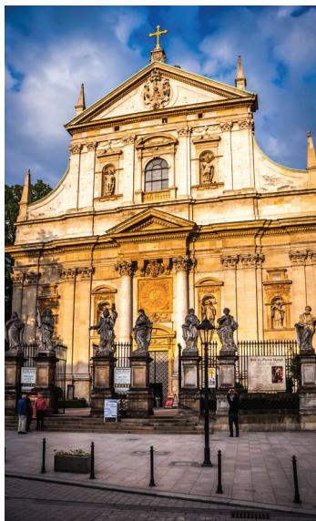
▼ Kościół św.św. Piotra i Pawła

Uniwersytecka świątynia to oszałamiający bogactwem dekoracji przykład stylu późnego baroku.