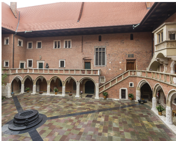
▲ Collegium Maius

Interesujące zbiory muzealne najstarszego polskiego uniwersytetu są prezentowane w nie mniej interesującym gmachu Collegium Maius. Budynek z pięknym arkadowym dziedzińcem jest rzadkim przykładem zachowanego w całości w niezmienionej formie gotyckiego obiektu architektury świeckiej.