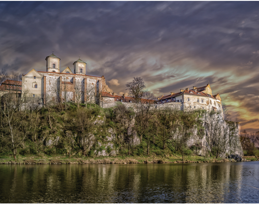
▲ Opactwo Benedyktynów w Tyńcu