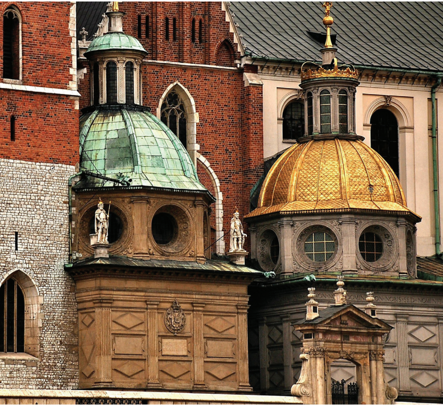
▲ Kaplice Wazów oraz Zygmuntowska przy wawelskiej katedrze

Skotnickich z 1339 r., później przebudowana. Zwraca w niej uwagę klasycystyczny pomnik Michała Bogorii Skotnickiego (zm. 1808), arystokraty i malarza – to kopia oryginalnego grobowca znajdującego się w bazylice Santa Croce we Florencji. Ostatnią od strony północnej jest kaplica Zebrzydowskich . Renesansową kaplicę znacznie przebudowano, ale zachował się pełen przepychu nagrobek biskupa Andrzeja Zebrzydowskiego (zm. 1560) wyrzeźbiony przez Jana Michałowicza z Urzędowa.