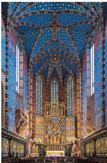
▲ Prezbiterium kościoła Mariackiego