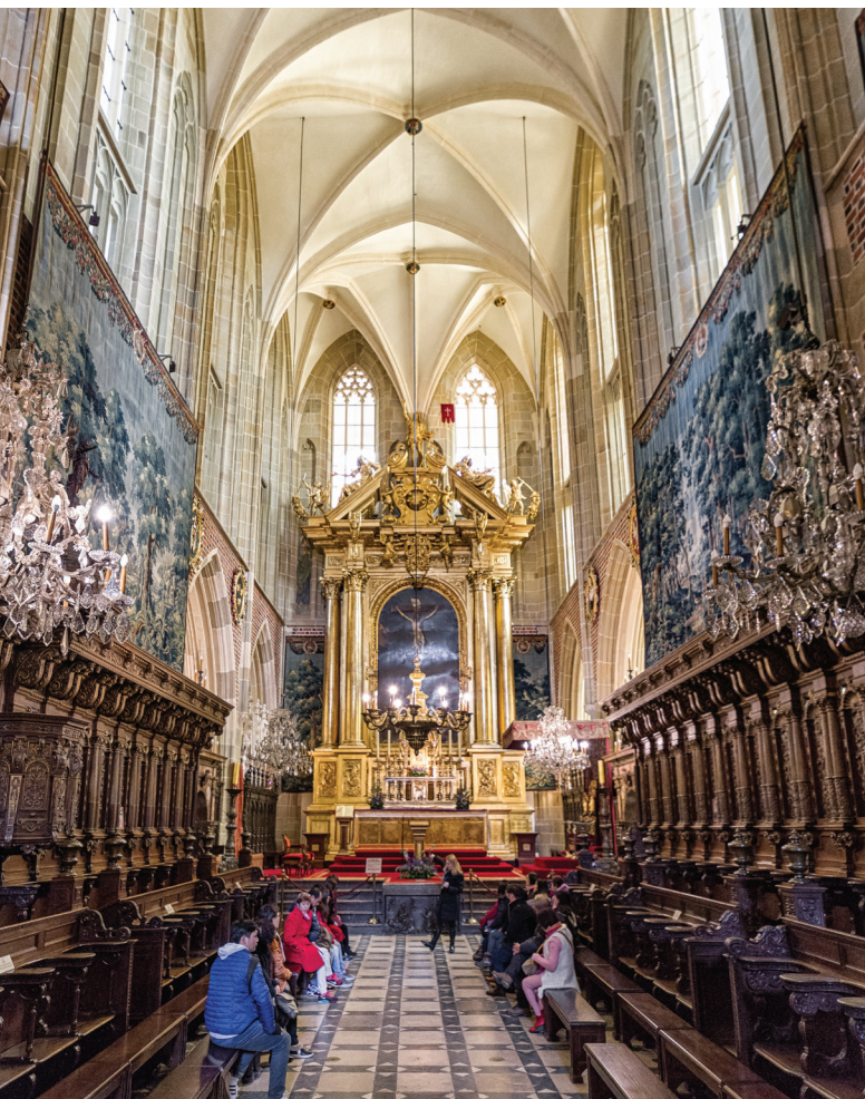
▲ Ołtarz główny wawelskiej katedry

Wzdłuż bocznych ścian prezbiterium stoją drewniane stalle – ławy dla duchowieństwa – pochodzące z 1620 r. i częściowo zrekonstruowane wraz z amboną na