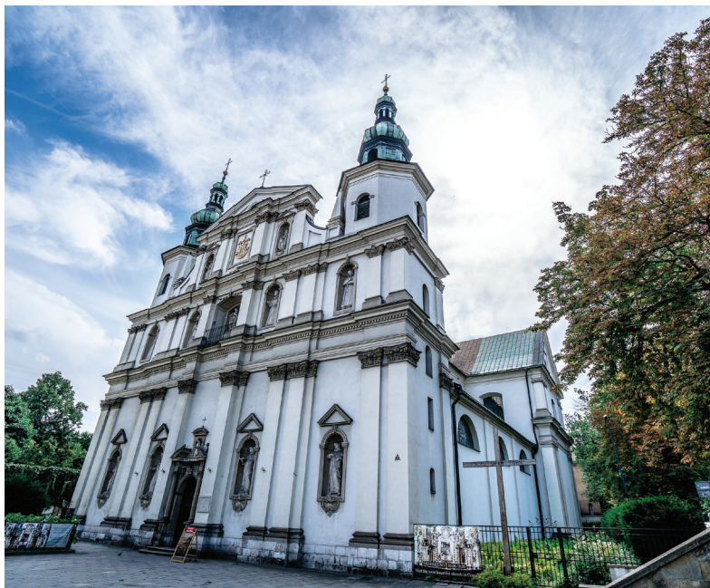
▲ Kościół św. Bernarda ze Sieny

Przybycie tego zakonu do Krakowa wiąże się ze św. Janem Kapistranem, który w 1453 r. trafił do miasta i na krakowskim Rynku Głównym wygłaszał płomienne kazania wzywające do pokuty za grzechy, walki ze zbytkiem i zepsuciem. Pod jego wpływem wierni przynosili „grzeszne” przedmioty, które następnie palono. Dużo trwalszym efektem jego kazań było wstąpienie przeszło 100 osób do założonego przez kaznodzieję właśnie w Krakowie nowego zakonu, w Polsce popularnie zwanego bernardynami.