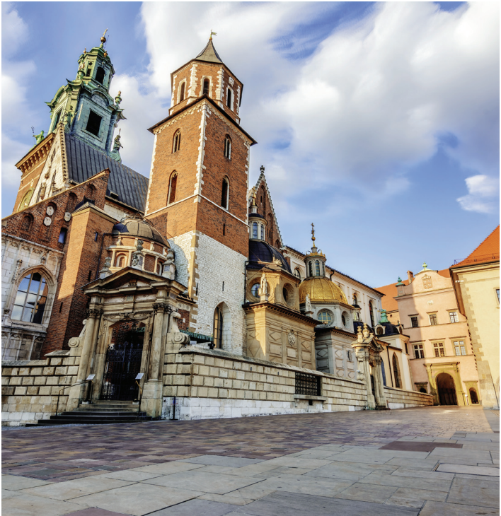
▲ Katedra wawelska