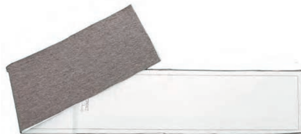
▲ ściągacz dołu