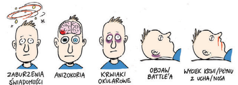
Objawy alarmowe po urazie głowy.