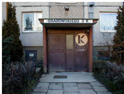
Po lewej: Z bratem przed naszym domem w Gdańsku-Siedlcach, 1981