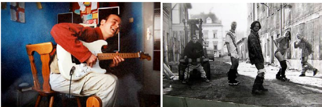
Po lewej: Nagrywanie z zespołem Gayery, Gdańsk, 1998