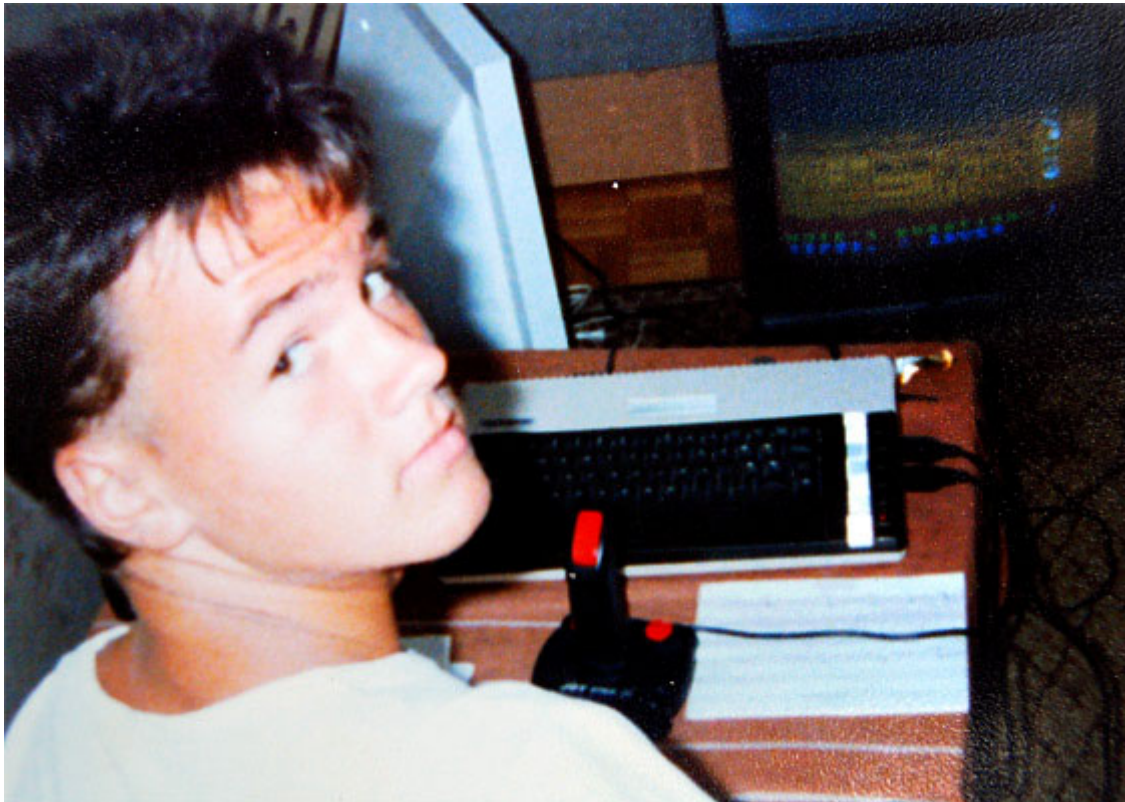
Pierwsze próby tworzenia muzyki na Atari XL, Gdańsk, 1990

Mój ojciec utrzymywał nas, pracując w Niemczech Zachodnich. Jego zarobki pozwalały nam na rzadko wtedy spotykane luksusy z zachodniego świata – ja i brat jako jedyni w okolicy bawiliśmy się klockami Lego, samochodzikami Matchbox i graliśmy na Atari XL, a później – na Amidze 500.