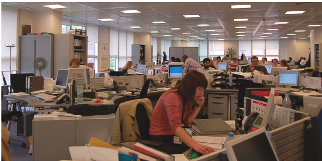
Dzień w biurze Bulldog Broadband przy Red Lion Square, Londyn, 2006-2007