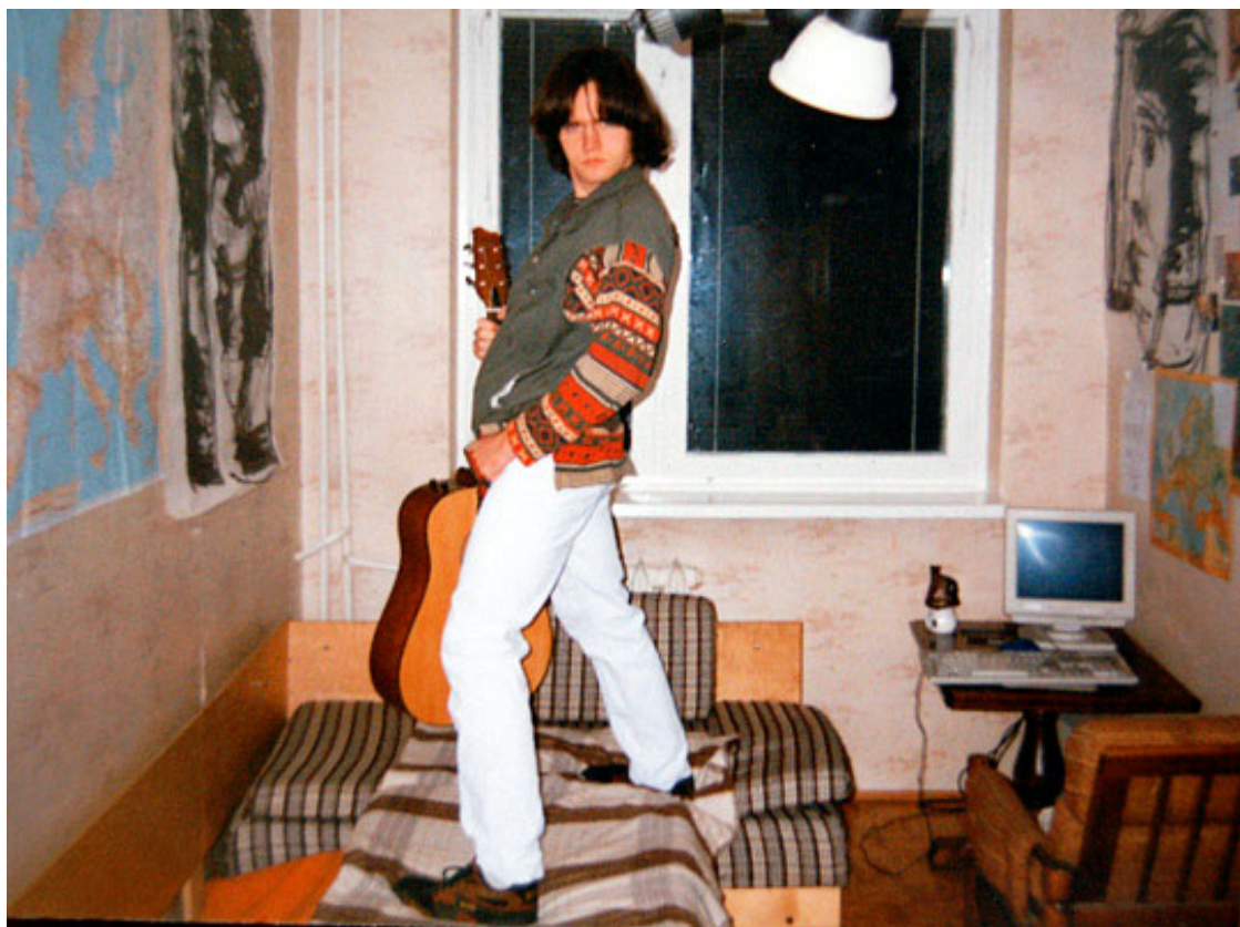
Pozowanie z gitarą, na ścianie mapy, Gdańsk, 1992

Książka Robbinsa tak bardzo mnie zainspirowała, że zacząłem szukać podobnych pozycji w miejscowej księgarni ezoterycznej. Trafiłem na „Być panem swego czasu i swego życia” Alana Lakeina z 1973 roku, w której autor dzieli się doświadczeniem i uwagami na temat produktywności. Dążyłem do tego, by jak najszybciej osiągnąć swoje cele, więc te informacje okazały się dla mnie bezcenne.