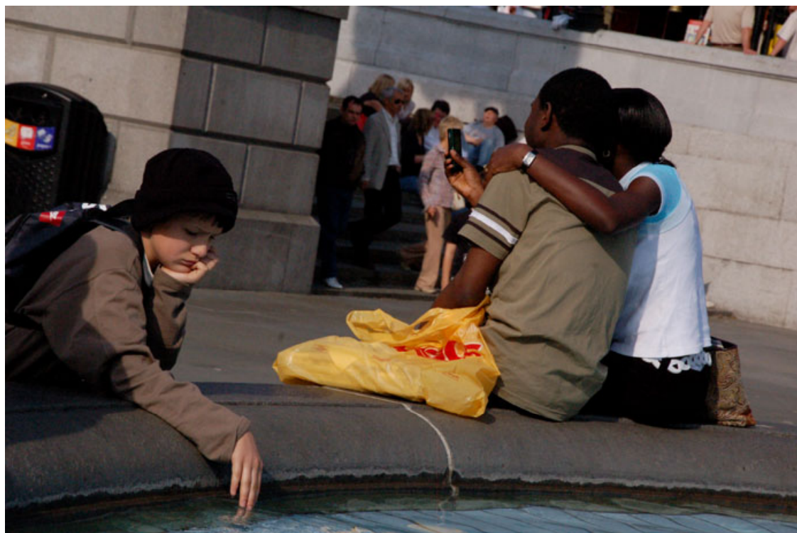
Czułem się mniej więcej tak, jak ten chłopak, Londyn, 2005-2006