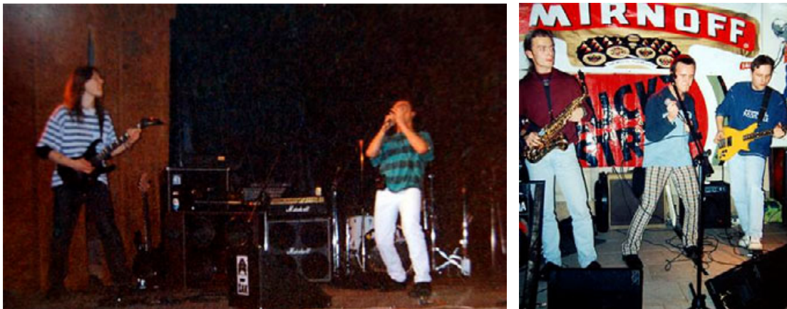
Po lewej: Koncert w Żaku z zespołem Fire, Gdańsk, 1996

Od wieku lat kilkunastu aż do dwudziestu kilku żyłem i oddychałem muzyką i występami na żywo. Byłem w stanie poświęcić wszystko, by podążać za moją pasją.