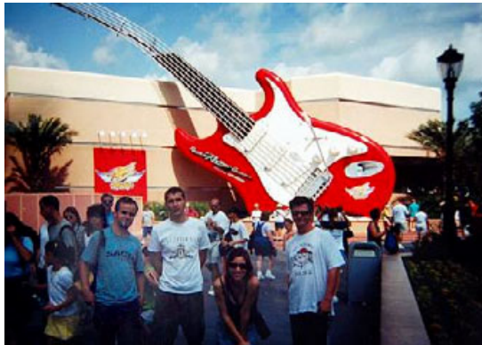
Floryda, Key West, Orlando, 1999

Lato przepracowane w Stanach było cennym doświadczeniem. Wróciłem do Polski pewny siebie i natchniony typowo amerykańskim nastawieniem do życia, dzięki któremu uważałem, że wszystko jest możliwe.