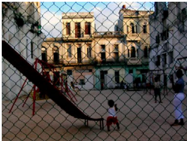
Na Kubie, Hawana, 2006

Zainspirowany karnawalem, jakiś czas później postanowiłem urządzić sobie samotne dwutygodniowe wakacje na Kubie. To był kolejny kamień milowy na ścieżce, którą szedłem, nim odważyłem się zostać podróżnikiem. Moje wakacje okazały się być pobudzającą mieszanką wędrówek z plecakiem, randek z tamtejszymi dziewczynami, nauki salsy, picia słynnego lokalnego rumu i palenia kubańskich cygar. Poznałem innych podróżników i imprezowałem z nimi, korzystając z życia. Niełatwo było mi opuścić cudowne, tropikalne ciepło i energię tego kraju, ale intuicja podpowiadała mi, że kiedyś tam wrócę.