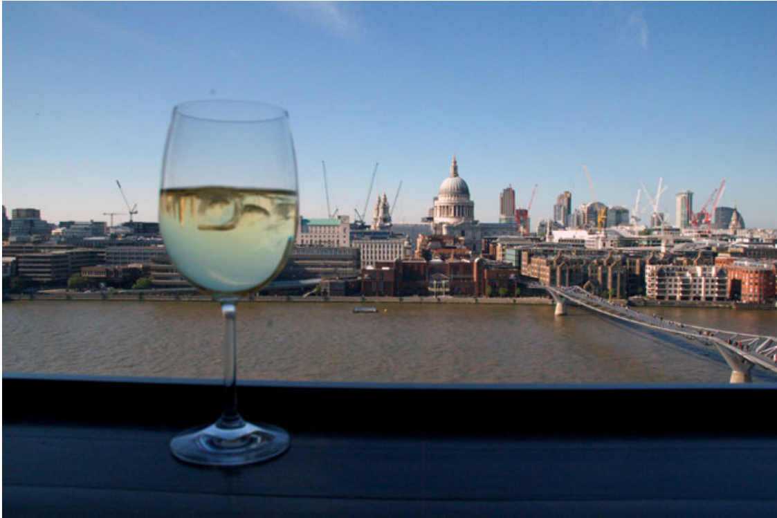
...a po pracy na piwko lub winko, Londyn, 2006-2007