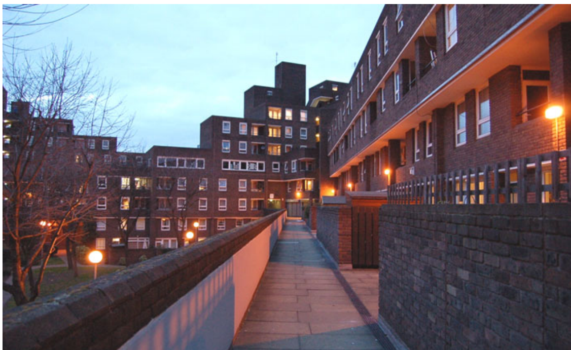
Mieszkanie w Angel, Londyn, 2006-2007

Nawiązywanie przyjaźni w Londynie nie wyglądało tak, jak w Polsce. Rzadko kiedy zdarzały się głęboko emocjonalne więzi i – chociaż udawałem, że wszystko jest w porządku – w głębi serca czułem się zawiedziony i tęskniłem za prawdziwą, szczerą rozmową o czymś, co miało dla mnie jakieś znaczenie. Nie radziłem sobie z tym dobrze.