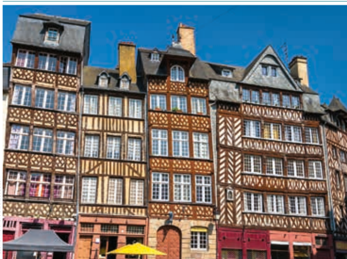
Domy szachulcowe w Rennes

Ze względu na duże zalesienie Bretanii tradycja budownictwa szachulcowego przetrwała tu aż do XIX w. W Rennes znajduje się 280 domów o drewnianej konstrukcji szkieletowej. Najstarsze budynki pochodzą z XV w. i mają duże nadwieszenia. Budowle XVI-wieczne można rozpoznać po mniejszych nadwieszeniach i dekoracjach z motywami renesansowymi (arabeski, putta itd.). Domy z XVII w. wyróżniają się całkowicie płaskimi, symetrycznymi fasadami. Z kolei w kamienicach z XVIII w. drewniana konstrukcja szkieletowa była stopniowo zasłaniana tynkiem.