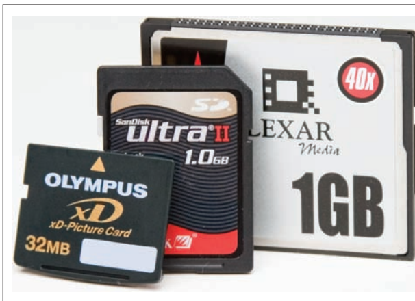
Rysunek 1.1. Dzięki możliwości zainstalowania jej zarówno w aparacie fotograficznym, jak i palmtopie, popularność niewielkich kart Secure Digital (pośrodku) znacznie wzrosła. Jej sąsiadka po lewej stronie, miniaturowa karta xD-Picture Card, obsługiwana jest wyłącznie w aparatach Fuji i Olympus. Najpopularniejszym nośnikiem zdjęć nadal są jednak duże karty CompactFlash (szczególnie w większych modelach aparatów)