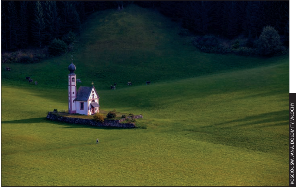
KOŚCIÓŁ ŚW. JANA, DOLOMITY, WŁOCHY