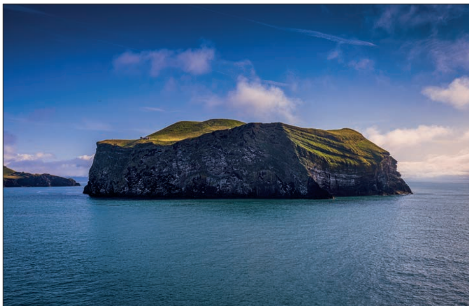
HEIMAEY, VESTMANNAEYJAR, ISLANDIA

Jednym z najczęstszych błędów, jakie widuję na fotografiach podróżniczych i krajoobrazowych, jest przekrzywiona linia horyzontu. Zarazem jest to najprostszy do usunięcia błąd. Przekrzywiony horyzont jest zły po prostu dlatego, że bardzo przeszkadza w odbiorze zdjęcia. Może widziałeś u kogoś na ścianie w domu lub w biurze oprawione zdjęcie, które wisi trochę krzywo? Na takiej fotografii nie sposób się skupić — aż korci, by przyskoczyć i ją wyprostować. Przekrzywiony horyzont jest cyfrowym odpowiednikiem takiej sytuacji i psuje mnóstwo zdjęć. W ferworze fotografowania czasami trudno jest zrobić idealnie proste zdjęcie — zwłaszcza jeśli pstryka się z ręki — ale ponieważ Lightroom i Photoshop potrafią wyprostować kadr jednym kliknięciem, pochyły horyzont nie ma dziś racji bytu. Dobre zdjęcia z podróży nie są przekrzywione, skoryguj więc linię horyzontu. (Zanim podejdziesz i sam wyprostujesz to zdjęcie wiszące za Twoim biurkiem. Jasne, pewnie poczekam, aż na chwilę wyjdiesz, ale gdy tylko znikniesz mi z oczu, podbiegnę, by ustawić je prosto!).