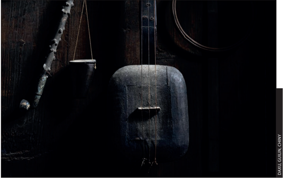
DAXU, GUILIN, CHINY

Światło jest tak ważne, że czasami wystarczy jego odrobina, by wyczarować ciekawą scenę i nadać czemuś zwykłemu tajemniczy albo egzotyczny wygląd, tak jak stało się w przypadku tego zdjęcia, przedstawiającego instrument muzyczny i narzędzia wiszące na ścianie w wiejskim domu w Chinach. Moją uwagę przykuło właśnie miękkie światło — przez szczelinę w blaszanym dachu nad tymi przedmiotami wpadało go bardzo niewiele, ale to właśnie jemu zawdzięczam dramaturgię i nastrój tego ujęcia. Spacerując po mieście, warto zwracać uwagę na takie szczypty urzekającego światła, bo często nie wymagają one interesującego tematu. Tematem staje się samo światło.