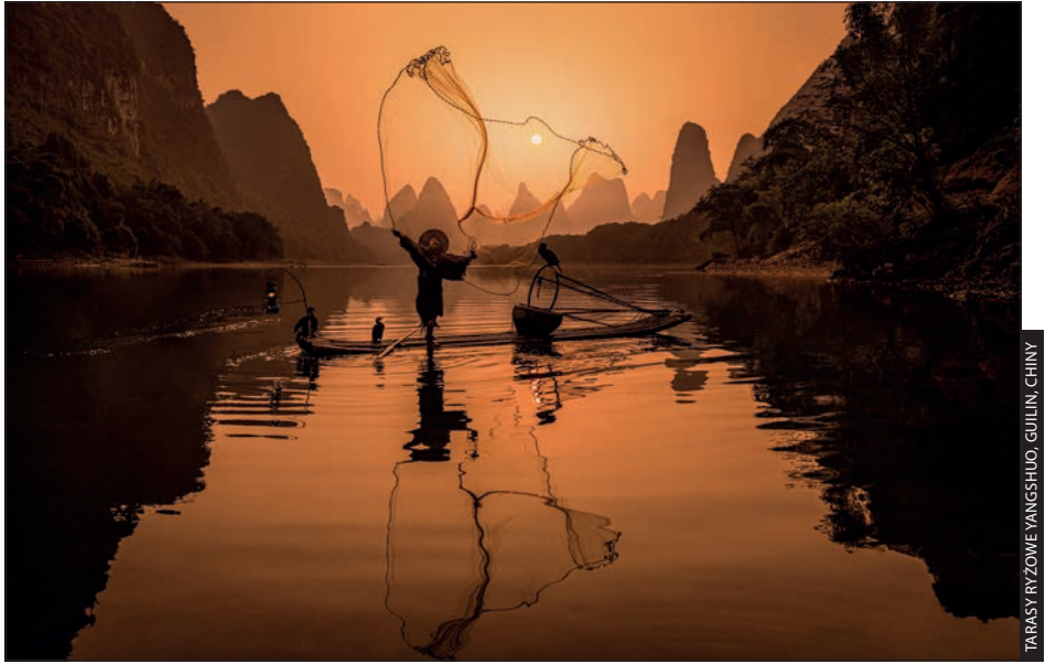
TARASY RYZOWE YANGSHUO, GUILIN, CHINY

Czy głównym tematem znakomitego zdjęcia z podróży może być kolor? Jasne. A piękne światło o poranku? Bez wątplenia. Pierwiastek ludzki? Oczywiście. W tym rozdziale napisałem o wielu czynnikach, które umożliwiają zrobienie znakomitej fotografii z podróży, lecz jeśli chcesz podnieść sobie poprzeczkę, pomyśl o połączeniu kilku z nich w jednym zdjęciu. Może to być miejsce sfotografowane w pięknym świetle cechujące się ciekawą kolorystyką oraz obecnością tubylców. Dzięki temu przywieziesz z podróży jeszcze lepsze kadry. Łącząc poznane elementy umożliwiające robienie fantastycznych zdjęć podróżniczych, stworzysz wielowarstwowe obrazy, w których widzowie po prostu się zakochają. Przyjrzyj się choćby przykładowej fotografii powyżej. W tym jednym kadrze dzieje się bardzo wiele: jest świetna, wyrazista kolorystyka; zdjęcie zostało zrobione niedługo po wschodzie słońca, więc cienie są wciąż dość miękkie; widać efekty atmosferyczne (mgiełka na niebie); jest element ludzki — tutejszy rybak zarzuca sieć (akcja!) w ciekawej scenerii. Do tego dochodzi skuteczna obróbka w cyfrowej ciemni (skorygowałem balans bieli tak, by ocieplić kolorystykę sceny, zwiększyłem kontrast i usunąłem odwracające uwagę detale). Dzięki połączeniu takich cech zdjęcie staje się głębsze, wielowymiarowe i skłania widza do uważniejszego spojrzenia.