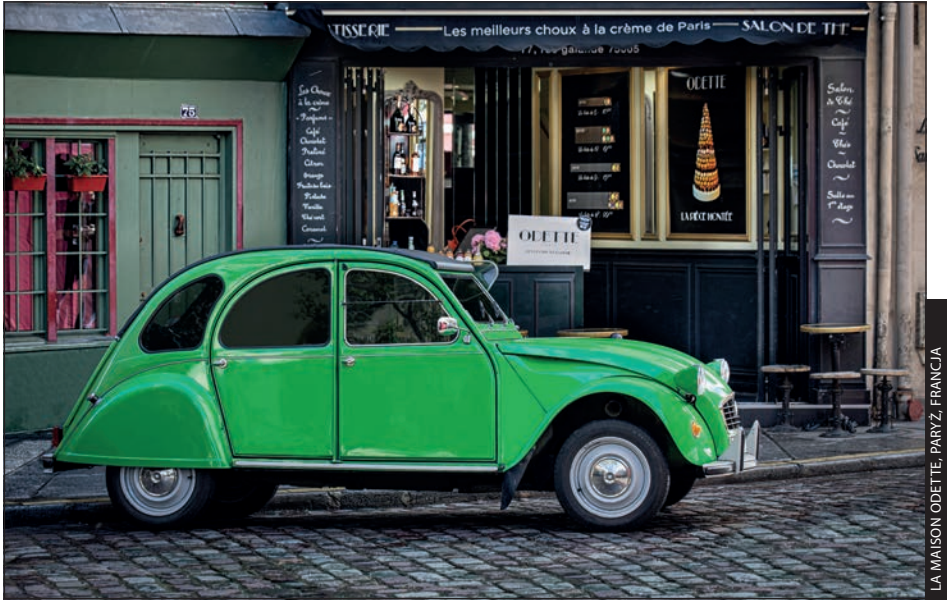
LA MAISON ODETTE, PARYŻ, FRANCJA

Pamiętam, jak pewnego dnia spacerowałem z żoną po nabrzeżu portowym, do którego zamówiono mnóstwo małych łodzi, ale zamiast robić im zdjęcia po prostu siedłem przed siebie, mijając ich dziesiątki. Wreszcie moja żona przystanęła, wskazała pobliską łódź i zapytała: „Co z nią nie tak? Wygląda uroczo”. Zgodziłem się — była urocza — ale miałem też inne zdanie. „Widzisz ten wielki silnik Mercury Marine uciepiony do rufy? Zabija cały urok i romantyczność tej sceny. Szukam zwykłej, prostej łodzi wiosłowej. Tylko wiosła. Żadnego wielkiego motoru. Żadnych plastikowych butelek walających się po dnie. Żadnego radia, foliowych toreb. Nic, co pozwoliłoby określić czas zrobienia zdjęcia”. Zrozumiała mnie bez dalszych wyjaśnień i wraz ze mną zaczęła szukać takiej urzekającej łodzi. Oczywiście możesz robić świetne, nowoczesne zdjęcia, ale to jak naklejenie na fotkę informacji o dacie wykonania. Jeśli uda Ci się skomponować kadr tak, by nie było w nim widać świadczących o współczesności napisów albo samochodów w tle, zyskasz okazję do pokazania widzowi obrazu ponadczasowego — pełnego uroku, romantyzmu i okazji do własnych interpretacji. Poza tym szukanie takich scen jest po prostu przyjemne. Może nie zawsze łatwe, ale jeśli uda Ci się skomponować ów idealny ponadczasowy kadr, przekonasz się, że było warto.