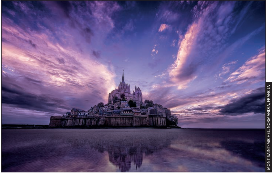
MONT SAINT-MICHEL, NORMANDIA, FRANCJA