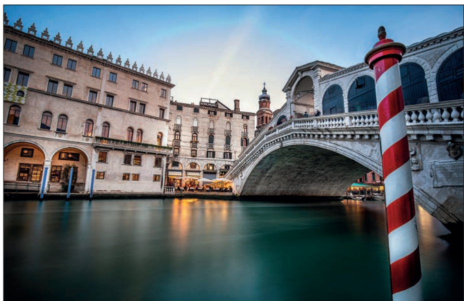
MOST RIALTO, WENECJA, WŁOCHY

Dobre zdjęcia z podróży nie są rozmyte. Nie są trochę nieostre. Jeśli patrząc na zdjęcie zadajesz sobie pytanie: „Czy ono jest ostre?“, znaczy to, że nie jest. Świetne fotografie podróżnicze mogą być naturalnie miękkie — takie jak zrobiona o poranku fotka wśród unoszących się mgieł — ale nie mogą być nieostre. Przejrzyj na Instagramie zdjęcia dowolnych świetnych fotografów-podróżników. Czy przy którymkolwiek pomyślisz sobie: „Hmm, to zdjęcie wygląda na trochę nieostre...”? Nie. Ci spece dbają o perfekcyjne ustawianie ostrości, ponieważ (powiedz to razem ze mną): „Znakomite zdjęcia z podróży są ostre”. Gdy światła jest mało i czas naświetlania się wydłuża (co nie stanowi problemu podczas fotografowania w plenerze w słoneczny dzień), może Ci się przydać lekki statyw albo platy pod. Kiedy zobaczysz, jak ostre i wyraziste są zrobione przy ich użyciu zdjęcia, przekonasz się, że warto było zabrać dodatkowe akcesorium. Jeśli zrobisz zadowolająco wyraziste zdjęcie, możesz przy użyciu Photoshopa czy Lightrooma przemienić je w ostre jak żyłeczka — dostępne w tych programach narzędzia do wyostrania są znakomite (więcej na ten temat możesz przeczytać w rozdziale 12.). Ale jeżeli zrobisz rozmyte zdjęcie, te programy jedynie złagodzą rozmycie — nie wyczarują z niego ostrego obrazu. O to musisz zadbać już w aparacie.