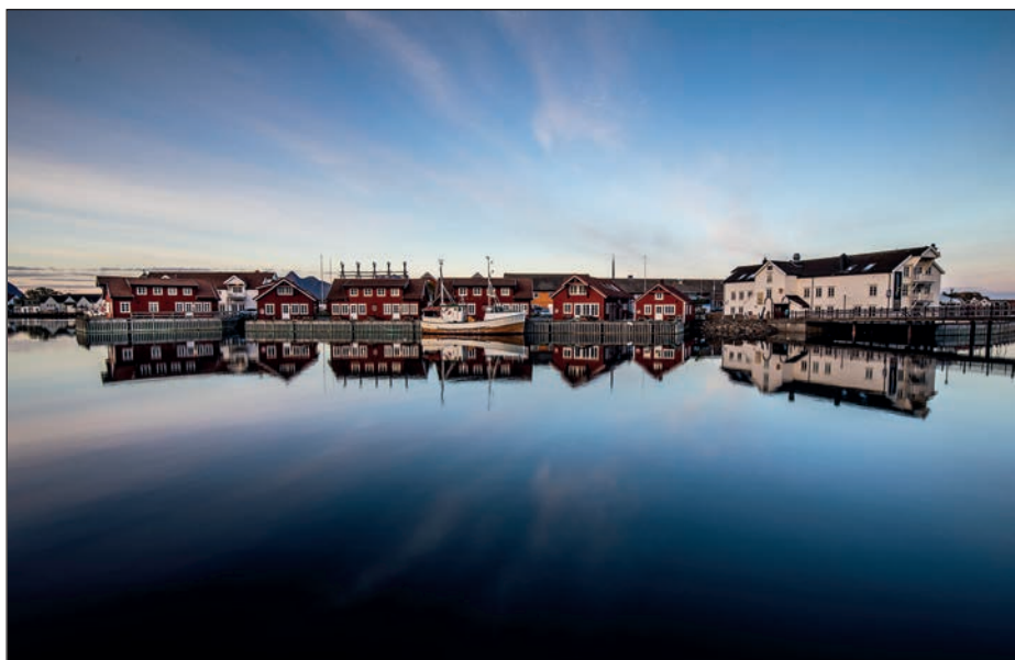
SVOLVER, LOFOTY, NORWEGIA