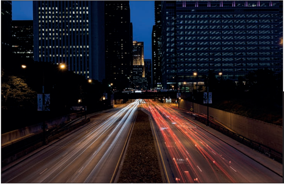
WIADUKT DLA PIESZYCH W PARKU LINCOLNA, CHICAGO, ILLINOIS, STANY ZJEDNOCZONE

Ilekcóż nadarza Ci się okazja do pokazania na zdjęciu ruchu lub akcji, masz szansę przyciągnąć uwagę widza. To zdjęcie zostało zrobione z długim czasem naświetlania, gdy ulicą poniżej pędziły samochody. Ale tematem może być wszystko, od tuk-tuka (mała, trójkołowa taksówka), przez kajak pędzący z nurtem rzeki lub konia z bryczką, aż po dzieciaki grające w koszykówkę w parku. Zamrożenie akcji w kadrze lub wyeksponowanie ruchu — te dwa narzędzia mogą pomóc Ci w robieniu znakomitych zdjęć z podróży.