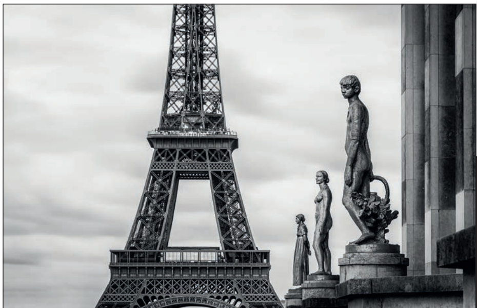
WIEŻA EIFFLA, PARYŻ, FRANCJA