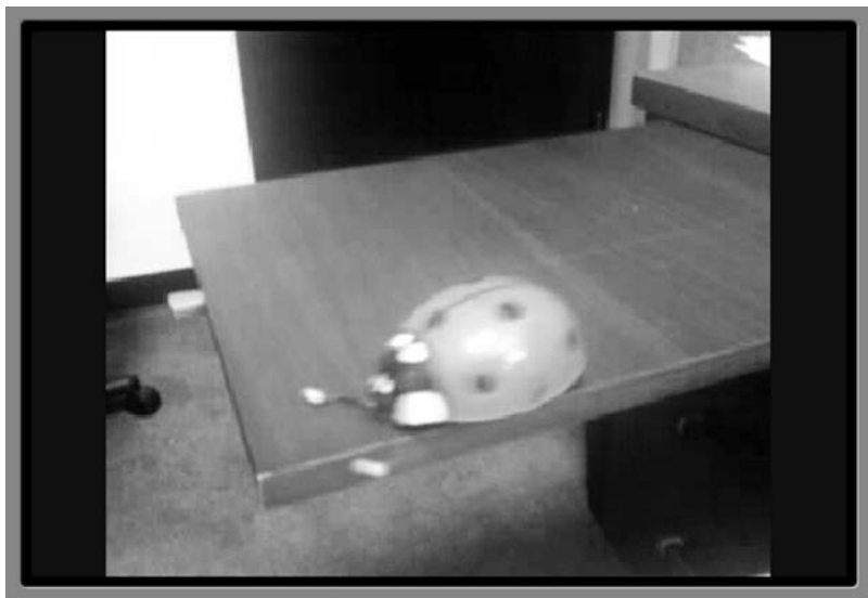
Rysunek 5.3. Dzięki klasie VideoView wstawianie plików wideo nie stanowi problemu