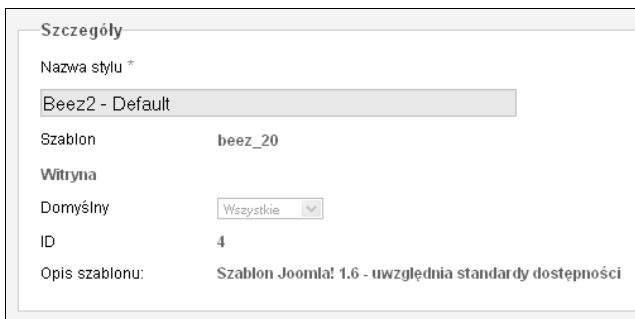
Rysunek 6.2. Podstawowe informacje o stylu szablonu

W menedżerze szablonów klikamy tytuł Beez2 . Zostanie otwarty edytor stylu. W sekcji Szczegóły , widocznej na rysunku 6.2, znajdują się podstawowe informacje. Nie ma tu zbyt wielu możliwości edycyjnych. Można jedynie wprowadzić własną nazwę, jeśli bieżąca nam nie odpowiada.