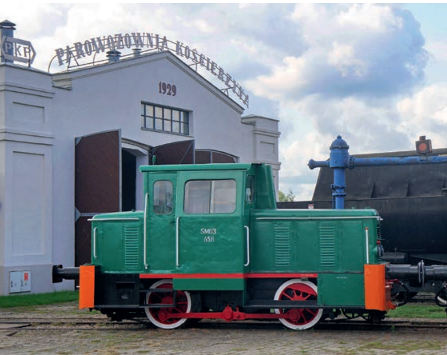
▲ Muzeum Kolejnictwa w Kościerzynie

starostwa powiatowego. To zarazem jeden z najstarszych budynków miasta. Jego bryła zachwyca lekkością, której nabrała podczas przebudowy pod koniec XIX w.