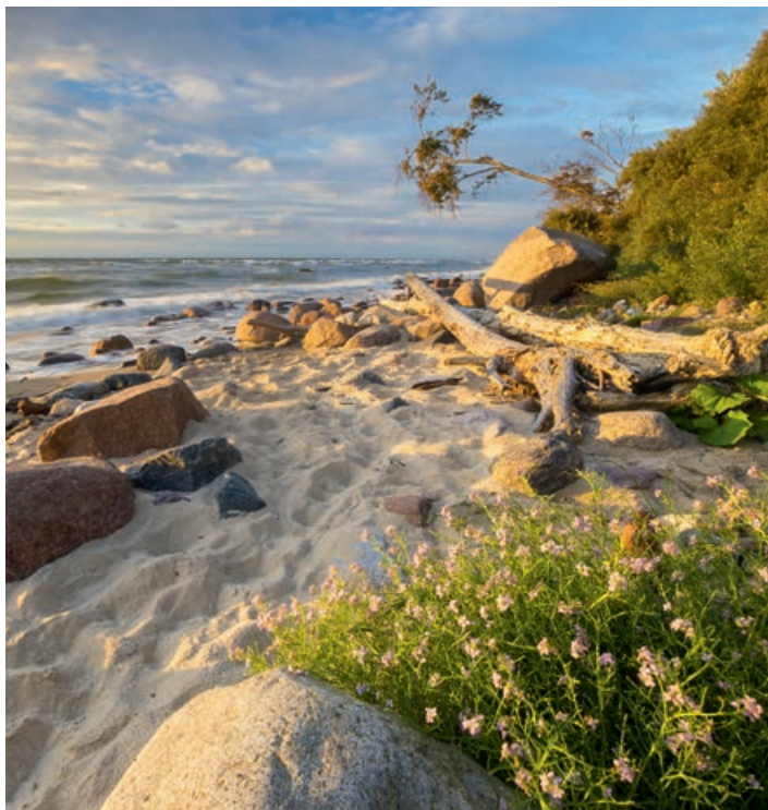
▲ Nadmorski Park Krajobrazowy