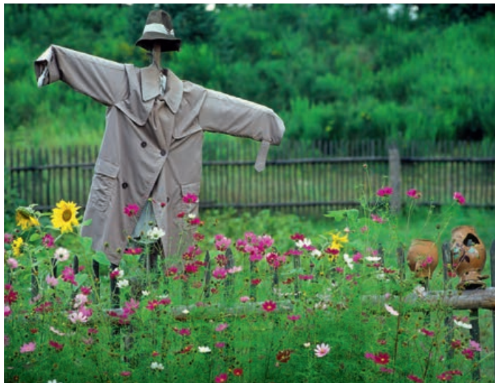
▲ Skansen we Wdzydzach Kiszewskich