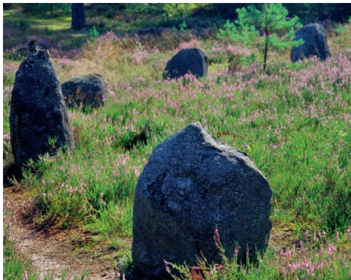
▼ Kamienny krąg