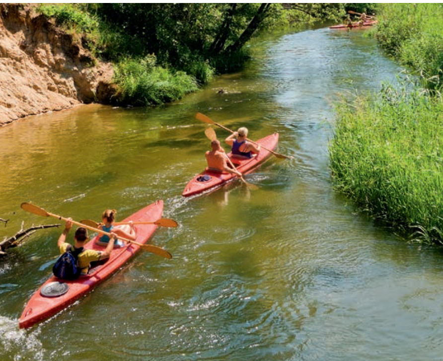
▲ Spływ kajakowy Wdą

Wdzydzkiego Parku Krajobrazowego. Jest unikalnym w skali Niżu Środkowoeuropejskiego połączeniem wypelnionych wodą rynien polodowcowych. Jeziora Wdzydze, Jelenie, Radolne i Gołoń tworzą Krzyż Jezior Wdzydzkich. Osobliwością akwenu jest dziewięć dużych wysp, które dzielą go na kilka części. Największa wyspa, Ostrów Wielki (90,66 ha), jest drugą pod względem wielkości wyspą jeziorną w Polsce (po Wielkiej Żuławie na Jezioraku). Wszystkie wyspy mają ogromne znaczenie dla przyrody kaszubskiego morza. Ich przybrzeżne trzciny są domem dla ptactwa wodnego, choć najcenniejszy wdzydzki ptak – tracź długodzioby , zwany także szlacharem – woli budować gniazda nieco dalej od wody. We Wdzydzkim Parku Krajobrazowym żyje potowa polskiej populacji tego gatunku z rodziny kaczko-