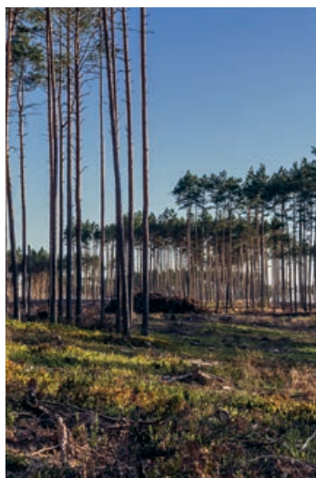
▲ Wiatrołomy w Zaborskim Parku Krajobrazowym

Rozległy i pełen tajemniczych zakamarków akwen, który można penetrować zarówno od strony lądu, jak i z wody.