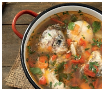
▲ Zupa rybna

Porządnie schłodzona galareta z mięsa lub ryb.