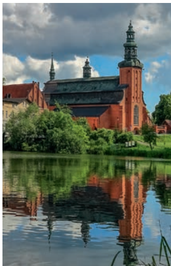
▲ Kolegiata w Kartuzach