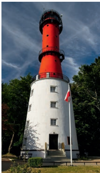
▲ Latarnia morska Rozewie

Dawne miejskie umocnienia dziś stanowiące bastion kultury.