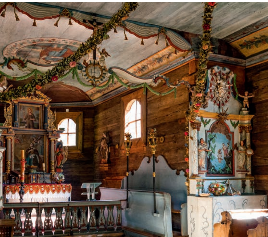
▲ Kaszubski Park Etnograficzny – wnętrze zabytkowego kościoła

o wysokości 35,6 m z trzema tarasami, z których można zobaczyć szeroką panoramę miejscowości i jej okolic. Położona na terenie stacji wodnej PTTK Wdzydze wieża jest jedynym miejscem, z którego widać cały Krzyż Jezior Wdzydzkich z licznymi półwyspami i zatoczkami oraz wyspę Ostrów Wielki.