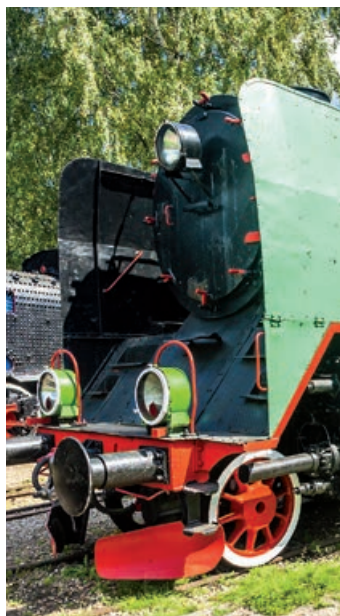
▲ Muzeum Kolejnictwa w Kościerzynie