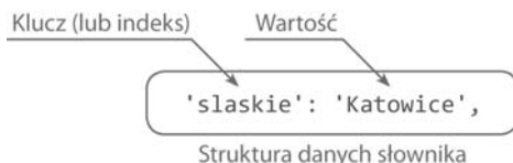
Rysunek 5.6. Sposób odwoływania się do wartości przechowywanych w słowniku

Po uruchomieniu powyższego programu w wierszu poleceń wyświetli on łańcuch znaków slaskie . Najważniejsze jednak w tym przykładzie jest to, że kluczem skojarzonym z wartością "Katowice" jest "slaskie". Zwrócić uwagę na polecenie print oraz sposób, w jaki odwołuje się ono do wartości zapisanej w słowniku (przedstawiony na rysunku 5.6).