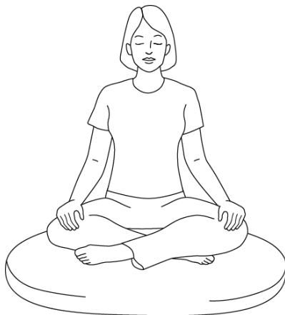
Podstawowa pozycja medytacyjna z luźno skrzyżowanymi nogami

Nogi: Jeśli siedzisz na poduszce, skrzyżuj przed sobą luźno nogi w kostkach lub tuż powyżej. (Jeżeli podczas medytacji drętwieją Ci nogi, zmień skrzyżowanie albo weź sobie dodatkową poduszkę, żeby usiąść wyżej). Kolana powinny znajdować się niżej niż biodra. Osoby, które nie są w stanie skrzyżować nóg, mogą usiąść z jedną nogą zgiętą przed drugą, bez ich krzyżowania. Możesz też ukłęknąć na ławeczce do medytacji albo wsunąć między uda i łydki poduszkę, jakbyś siedział na niskiej ławce. Jeśli siedzisz na krześle, ustaw stopy płasko na podłodze. Dzięki temu będziesz siedzieć prosto, a Twój oddech będzie bardziej naturalny.