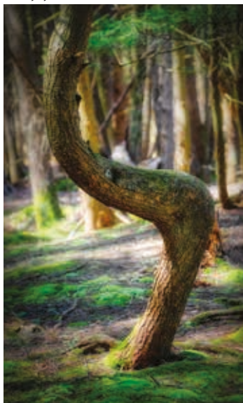
▼ Krzywy Las

Z wyniosłego klifu (o wysokości 15 m) między Trzemeszkiem a Rewalem rozciąga się wspaniały widok na morze oraz ruiny kościoła w Trzemeszku – zdjęcia urwistego brzegu, jako ilustracja procesu abrazji morskiej, znajdziemy w każdym polskim podręczniku geografii.