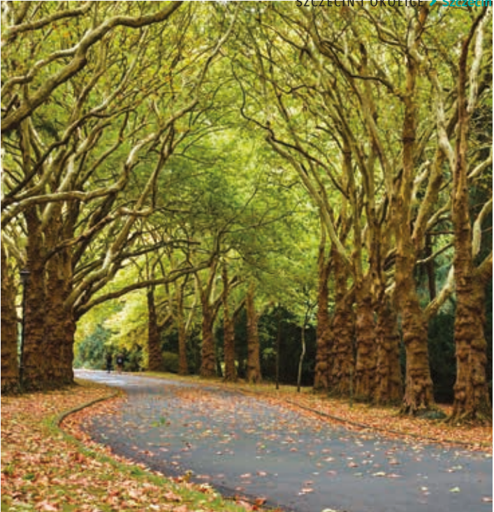
▲ Aleja platanów na Cmentarzu Centralnym

projekty cmentarza Centralnego, Wałów Chrobrego, budynku Muzeum Narodowego oraz kościoła św. Gertrudy na Łasztowni. Następnie szlak prowadzi przez wiele wymienionych wcześniej, ważnych dla historii Polski pomników. Trasa zwiedzania kończy się przy Pomniku Pamięci Kombatantów, złożonego z grotów kopii rycerskich i skrzydła husarskiego.