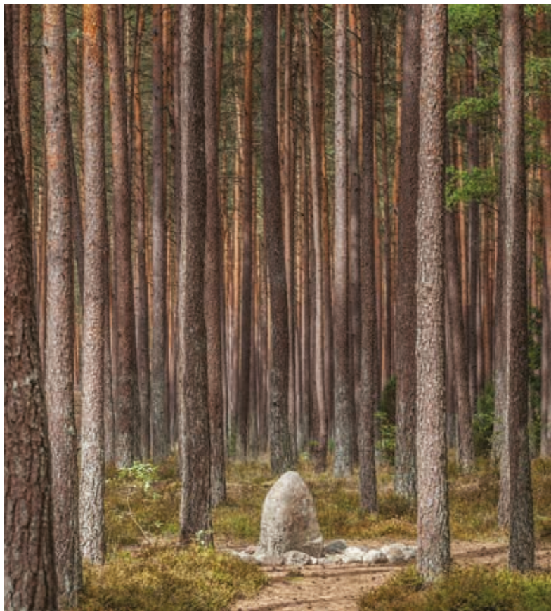
▲ Rezerwat „Kamienne Kręgi” w Grzybnicy