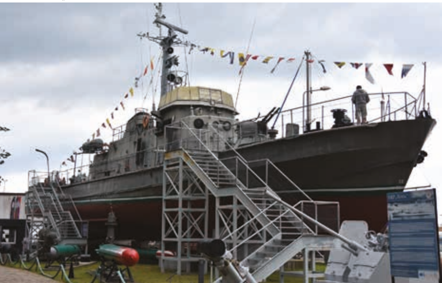
▼ ORP „Fala”

Z kolei w obiektach przy ul. Gierczak, w pobliżu XV-wiecznej kamienicy Kupieckiej , zgromadzono niezwykle eksponaty militarne od średniowiecza do współczesności. Zobaczymy tu maszynę szyfrującą Enigmę, mundury wojskowe, broń śre-