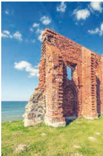
▲ Ruiny kościoła w Trzemeszcu