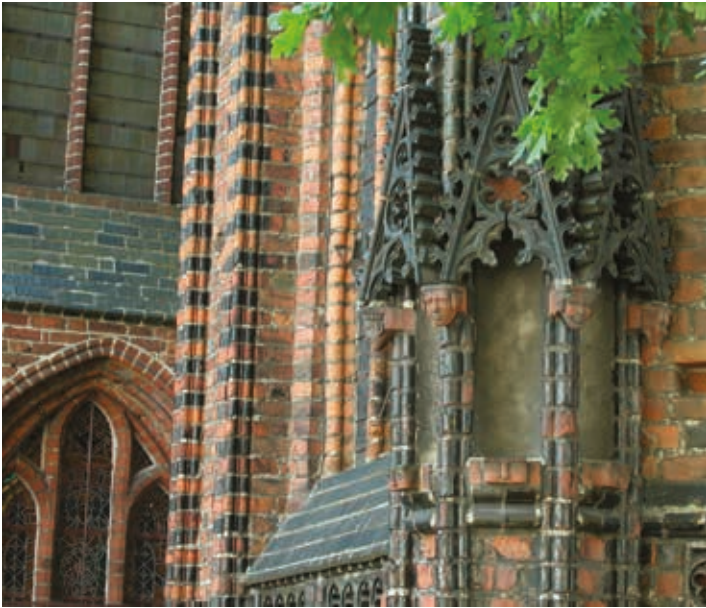
▲ Kolegiata Mariacka w Stargardzie