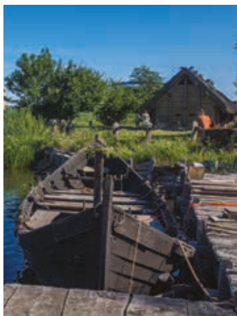
▲ Centrum Słowian i Wikin- gów Jomsborg Vineta