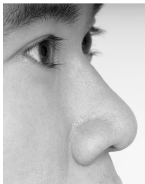
Nos tego mężczyzny jest stosunkowo płaski, co daje mu większą odporność na niskie temperatury