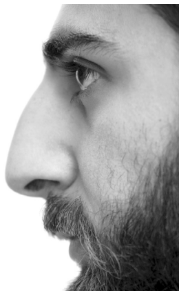
Wydutny nos tego mężczyzny jest dziedzictwem po przodkach, którym przydawał się on do nawilżenia suchego pustynnego powietrza, jakim oddychali

Mimo że ludzki nos jest większy niż u innych naczelnych, nasz zmysł węchu jest zdecydowanie słabszy. Może się to wydawać nielogiczne, warto jednak skupić się na innych istotnych funkcjach nosa: regulacji wilgotności i temperatury powietrza. Oczywiście nos służy do wąchania (choć ten zmysł stracił na znaczeniu, odkąd wzrok wyewoluował na najważniejszy z ludzkich zmysłów), ale oprócz tego pozwala oczyścić powietrze, które dociera do dróg oddechowych i zatok. Idealna temperatura wdychanego powietrza wynosi 35 stopni Celsjusza, a idealna wilgotność — 95%. Nos pozwala nam osiągnąć te warunki. Wyjaśnia to też, dlaczego ludzie żyjący w bardzo suchym klimacie (np. na Bliskim Wschodzie) często mają bardziej wydutne nosy. Po prostu większa powierzchnia błony śluzowej nosa pozwala na skuteczniejsze nawilżenie wdychanego powietrza.