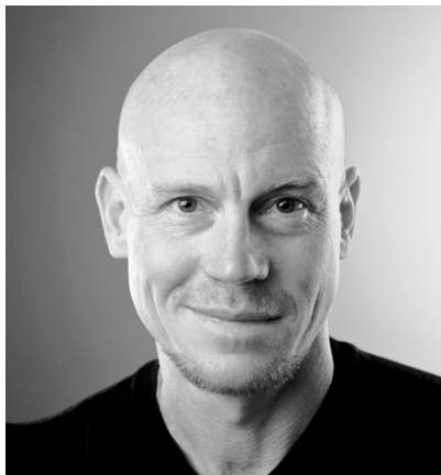
Łysy może być seksowny

Czoło i skronie to coś dla nowego intelektualisty. W miarę jak człowiek polegał coraz bardziej na potędze swojego mózgu, jego płaty czołowe rozwijały się, aby umożliwić nowe funkcje umysłowe. W wyniku poszerzania się istoty szarej (która ostatecznie zwiększyła swoją objętość ponadtrzykrotnie) czoło człowieka stało się wyższe i bardziej wypukłe. Rzut oka na czaszkę neandertalczyka wystarcza, aby dostrzec wyraźne łuki nadoczodołowe oraz niskie czoło, które są zupełnie inne od tego, jakie widzimy dzisiaj. Czoło neandertalczyka było cofnięte, a nie pionowe i wypukłe, jakie mają dzisiejsi ludzie. Kostne łuki nadoczodołowe nie znikły w procesie ewolucji, a zostały pochłonięte przez zupełnie nową cechę — czoło.