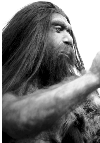
Długie włosy oznaczały dobre zdrowie teraz i w przeszłości

Należy jednak zachować ostrożność, porównując ewolucję włosów na głowie (związaną z eliminacją włosów, które szybko przestawały rosnąć albo rosły w nierównych kępkach lub też nie było ich wcale) do łysienia typu męskiego.